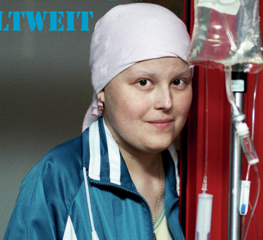
Foto: © 2005 Hermine Oberüc • Schriftsatz und Gestaltung: Ursula Zepfer